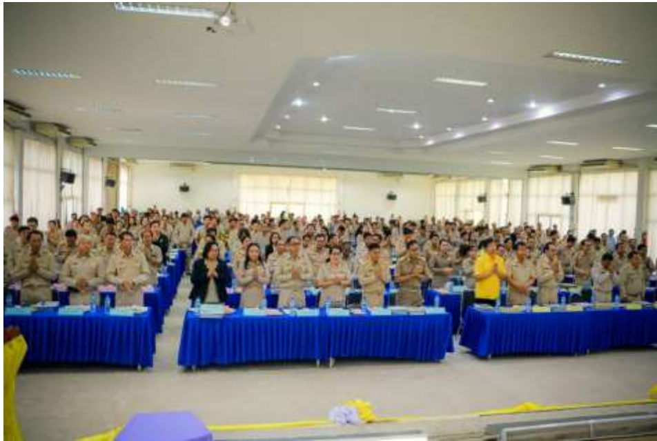
การประชุมคณะผู้บริหารสำนักงานเขตพื้นที่การศึกษา ผู้อำนวยการกลุ่ม/หน่วย สำนักงานเขตพื้นที่การศึกษา ประถมศึกษาสกลนคร เขต ๒