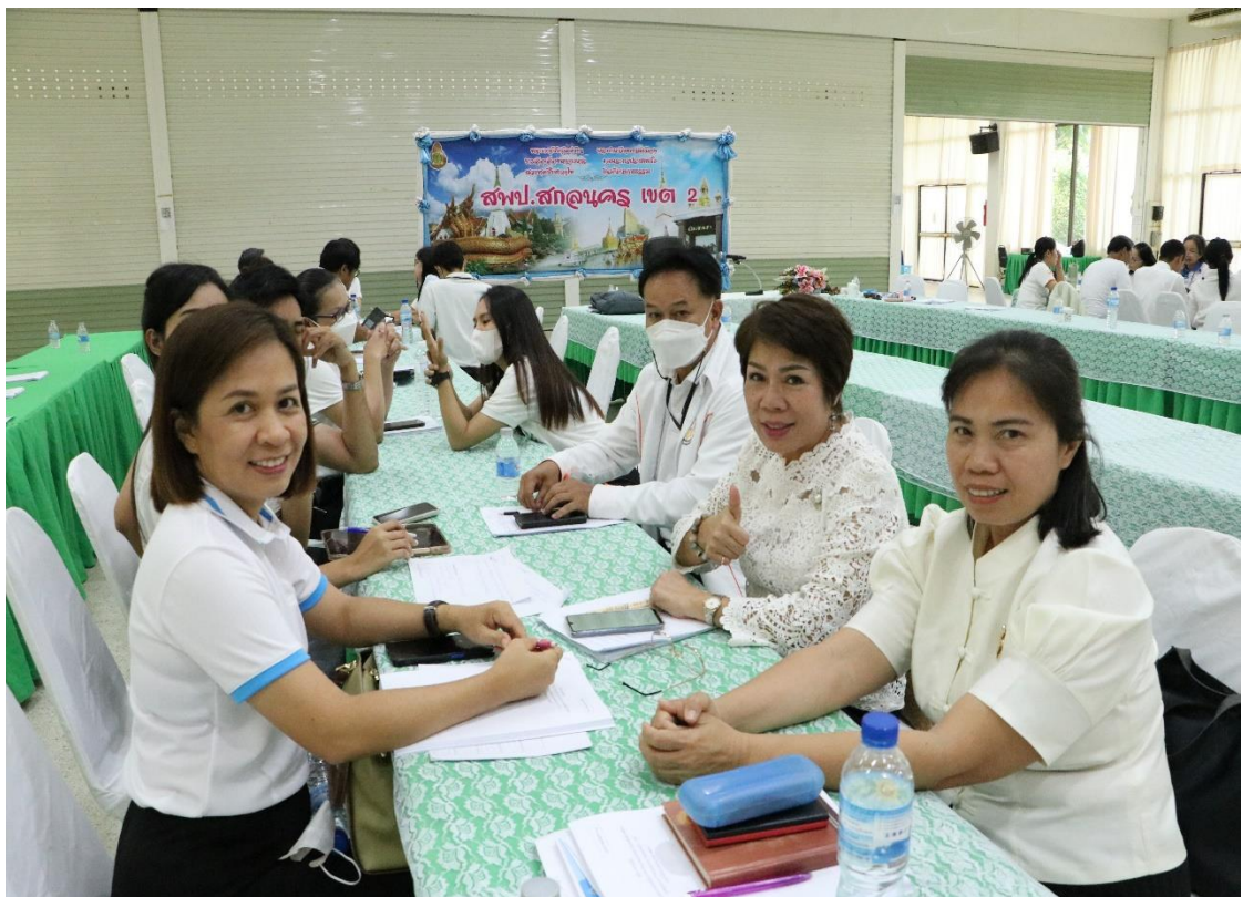
สำนักงานเขตพื้นที่การศึกษาประถมศึกษาศกนคร เขต ๒