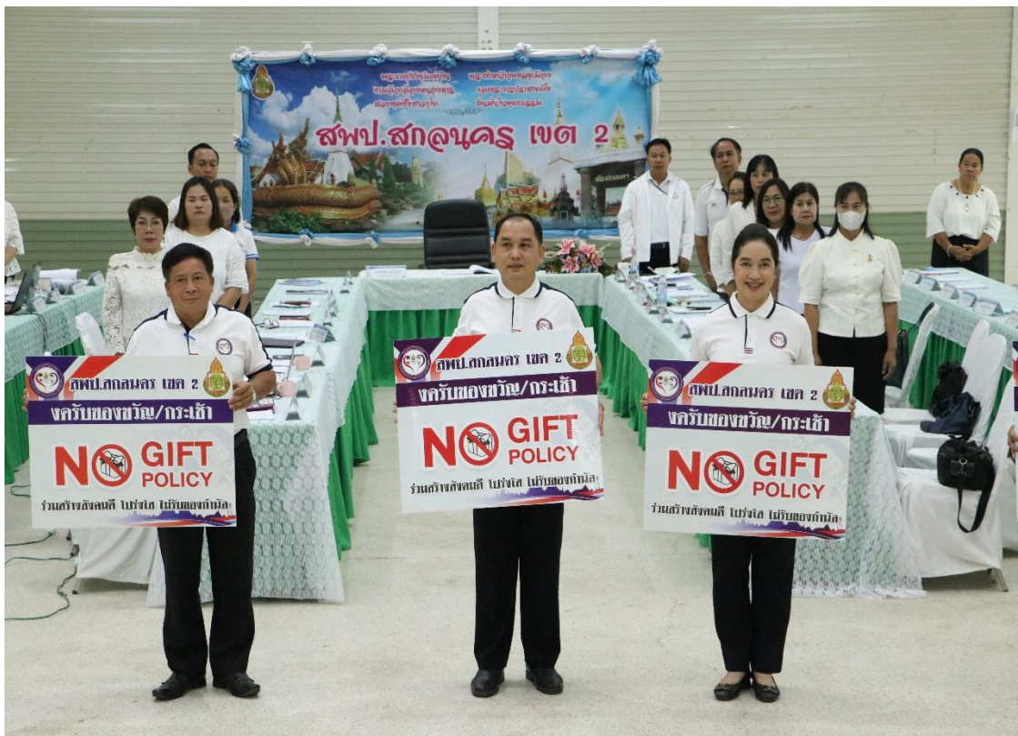
สำนักงานเขตพื้นที่การศึกษาประถมศึกษาสกลนคร เขต ๒