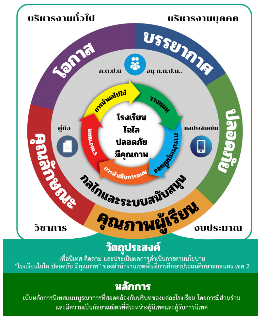
ภาพที่ 2 รูปแบบการนิเทศ ติดตาม และประเมินผลการดำเนินงานตามนโยบาย ของสำนักงานเขตพื้นที่การศึกษา ประถมศึกษาสกลนคร เขต 2

นั้นจึงนำรูปแบบที่พัฒนาขึ้นไปทดลองใช้ ซึ่งสอดคล้องกับการศึกษาของบุญชม ศรีสะอาด (2535) และ วาโรเพ็งสวัสดิ์ (2553) ที่ได้สรุปขั้นตอนในการพัฒนารูปแบบว่ามี 2 ขั้นตอน ได้แก่ ขั้นตอนที่ 1 การสร้างหรือพัฒนารูปแบบ และขั้นตอนที่ 2 การทดสอบความเที่ยงตรงของรูปแบบ นอกจากนี้ในส่วนของผลการพัฒนารูปแบบ ซึ่งสอดคล้องกับผลการวิจัยของ ทศน์ศิรินทร์ สว่างบุญ และบุญชม ศรีสะอาด (2563) ที่พบว่า รูปแบบการติดตาม ตรวจสอบและประเมินผลงานของมหาวิทยาลัยราชภัฏ แยกการประเมินออกเป็น 5 องค์ประกอบ ได้แก่ 1) การประเมินการปฏิบัติงานของมหาวิทยาลัยในการนำแผนกลยุทธ์มาสู่การปฏิบัติตามหลักการประเมินแบบสมดุล 2) การประเมินการดำเนินงานของมหาวิทยาลัยตามความคิดเห็นของผู้มีส่วนได้ส่วนเสีย ซึ่งพิจารณาจากผู้มีส่วนได้ส่วนเสียภายในและผู้มีส่วนได้ส่วนเสียภายนอก 3) การประเมินเว็บไซต์มหาวิทยาลัย 4) การประเมินโรงเรียนสาธิตในสังกัดมหาวิทยาลัยราชภัฏ และ 5) การติดตาม ตรวจสอบและประเมินที่เป็นปัจจุบัน ซึ่งรูปแบบการนิเทศ ติดตาม และประเมินผลการดำเนินงานตามนโยบาย ของสำนักงานเขตพื้นที่การศึกษาประถมศึกษาสกลนคร เขต 2 แสดงดังภาพต่อไปนี้