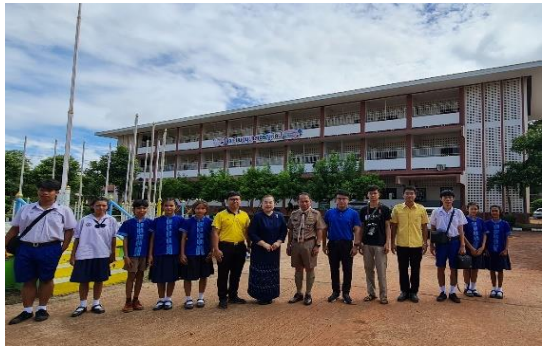
แหล่งเรียนรู้ประวัติศาสตร์ท้องถิ่น ศูนย์ศิลป์พาศิพุกุดนาขาม อำเภอเจริญศิลป์ จังหวัดสกลนคร